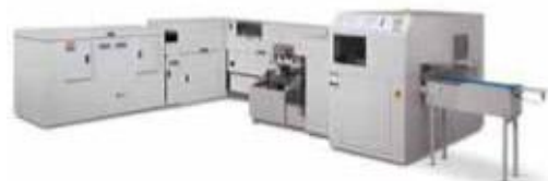
Xerox® Book Factory