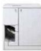
Устройство переплета Xerox® Tape Binder