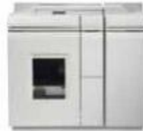
Базовый модуль финишера BFM Plus