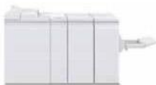
Брошюровщик Plockmatic Pro 30 (только для моделей 120/144/157)