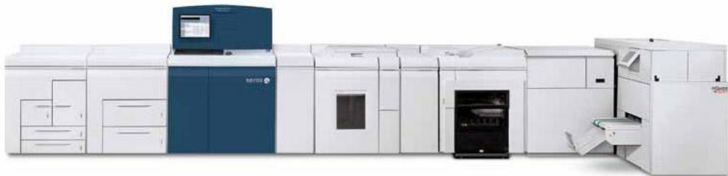
Промышленная система Xerox Nuvera ® 157 EA с промышленным укладчиком Xerox ® и Watkiss PowerSquare 200