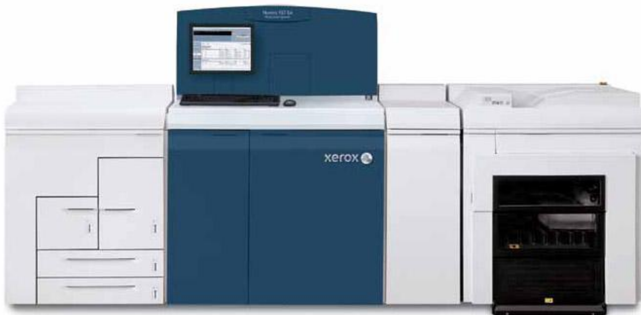
Система промышленной печати Xerox Nuvera® 157 EA с промышленным укладчиком Xerox®