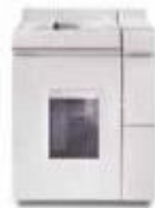
Базовый модуль финишера