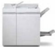
Многофункциональный финишер Pro Plus