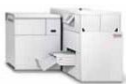
Watkiss PowerSquare 200