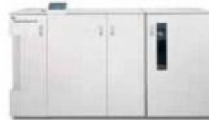
GBC FusionPunch II со смещающим лотком