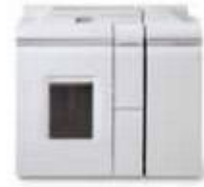
Базовый модуль финишера Direct Connect