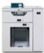
Податчик C.P. Bourg BSFх с поддержкой двух режимов работы