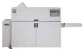
Брошюровщик C.P. Bourg BDFNx с функцией Square Edge